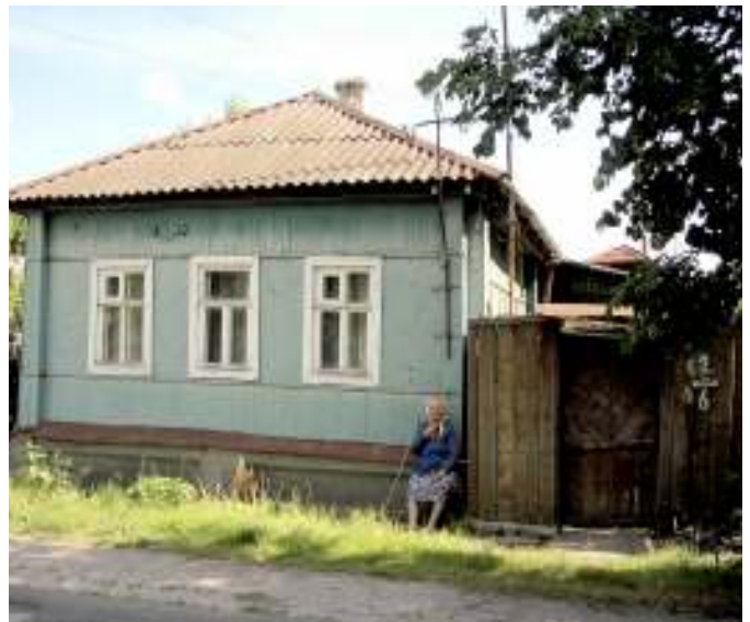
Dorf in Russland.

In Russland wächst die kritische Öffentlichkeit und fordert aktive Korruptionsbekämpfung. Laut einer Studie von Transparency International sind 2010 52 Prozent der Bevölkerung bereit, Beschwerde gegen korrupte Beamte einzulegen, 2009 waren es lediglich sieben Prozent. Zu dieser Bewusstseinsänderung tragen auch russische Blogger bei. Einer der populärsten Aufklärer ist Alexej Navalny. Er kauft sich regelmäßig in börsennotierte Unternehmen wie die VTB-Bank und Gazprom ein, deckt Korruptionsfälle auf und publiziert diese im Internet. Internetexperte Natalja Kon-