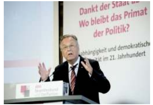
Plädiert für eine Stärkung des Parlaments: Hans-Jürgen Papier

Die anschließenden Wortmeldungen aus dem Publikum machten deutlich, dass Parteienverdrossenheit als eine Hauptursache des Vertrauensverlustes von Bürgerinnen und