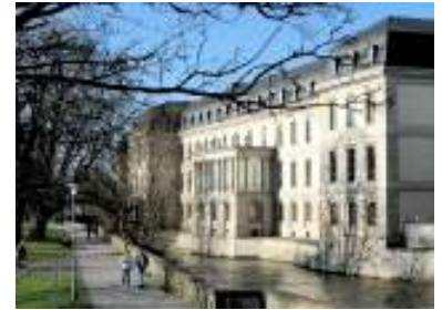
Niedersächsischer Landtag

Doch bei aller offenen Sympathie des Regierungspartners FDP für eine solche Regelung siegte schlussendlich die Koalitionsräson: Der Antrag wurde abgelehnt. Mit einer erfolgreichen, neuen Initiative in dieser, noch bis 2013 andauernden Legislaturperiode ist kaum zu rechnen. Es bleibt die Frage, was Erfolg versprechender und wahrscheinlicher ist: ein Regierungswechsel oder ein Umdenken bei vielen Personen in der Koalition. (Dennis Schwarz, Transparency-Regionalgruppe Niedersachsen)