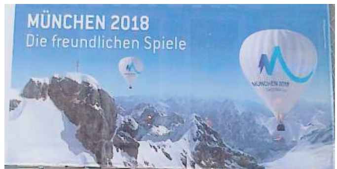
Olympiawerbung auf dem Marienplatz in München

□ Mehr Beteiligung der Betroffenen: Dieser Punkt hätte die Bewerbung beinahe zu einem vorzeitigen Scheitern geführt, was bei angemessener Beteiligung der Bürger wohl zu verhindern gewesen wäre. Ein frühes Einbeziehen zum Beispiel der Grundstückseigentümer in Oberammergau und