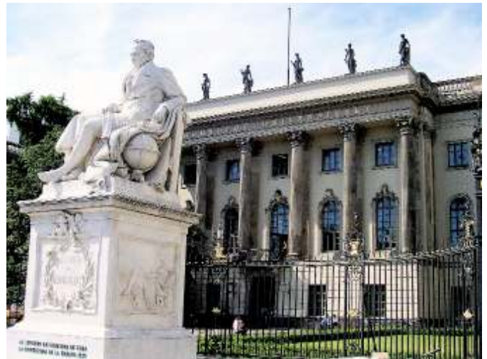
Humboldt Universität Berlin

Die Deutsche Bank hat sich über einen Sponsoren- und Kooperationsvertrag mit der Berliner Humboldt Universität sowie der Technischen Universität weit reichende Mitspracherechte in Lehre und Forschung zusichern lassen. Berichten des Onlineangebots taz.de zufolge regelte die bereits 2006 geschlossene Vereinbarung die gemeinsame Gründung eines Instituts für Angewandte Finanzmathematik, das den Namen „Quantitative Products Laboratory“ trägt. Mindestens drei Millionen Euro soll die Bank jährlich dafür bereitgestellt haben. Der erst Ende Mai bekannt gewordene Vertrag gestatte dem Unternehmen die Mitwirkung bei der Besetzung der zwei Stiftungsprofessuren und der Gestaltung der Lehre. Im Rahmen der Kooperation entstandene Forschungsergebnisse sollten der Bank vorab zur Freigabe vorgelegt werden. Auch die Übernahme von Lehraufträgen durch Unternehmensmitarbeiter und deren Heranziehung zu Prüfungen seien vertraglich geregelt. Darüber hinaus habe die Bank das Recht zu Unternehmenspräsentationen, Kontaktveranstaltungen und der Verteilung von Infomaterialien durch die hochschuleigene Hauspost. Transparenz sei das oberste Gebot der Wissenschaften,