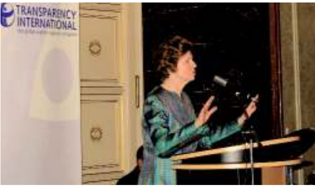
Die Vorsitzende von Transparency International, Huguette Labelle.

tion ein. Das öffentliche Interesse am Handeln der Unternehmen hat zugenommen. Vor diesem Hintergrund empfiehlt Transparency International Unternehmen, ihre internen Anti-Korruptionsanstrengungen extern überprüfen zu lassen. Darüber hinaus steht die Rolle von Führungskräften im Kampf gegen Korruption im Mittelpunkt.