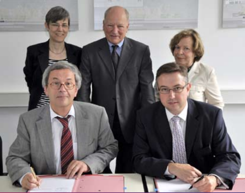
Unterzeichnung des Integritätspaktes in Hannover