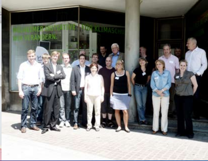
Einführungsseminar in Mülheim an der Ruhr