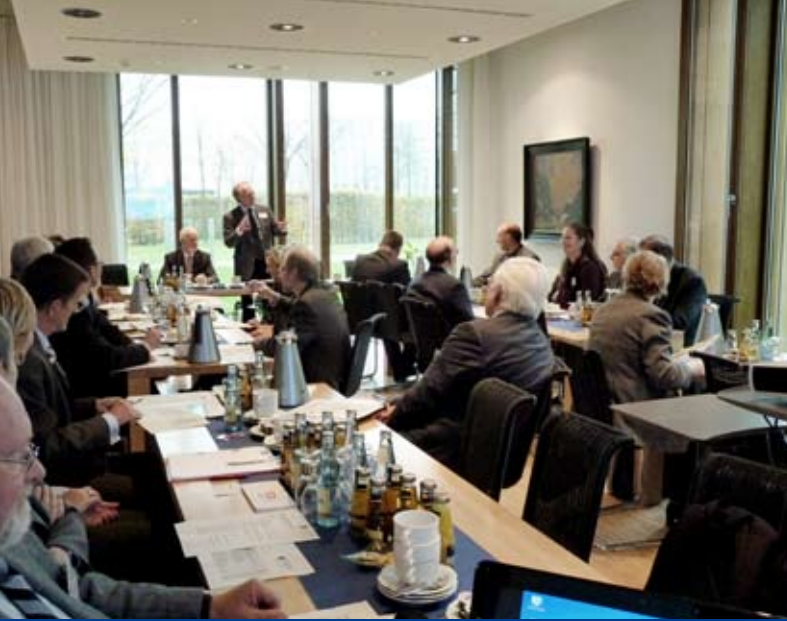
Erfahrungsaustausch zum Thema Hinweisgeber in Berlin