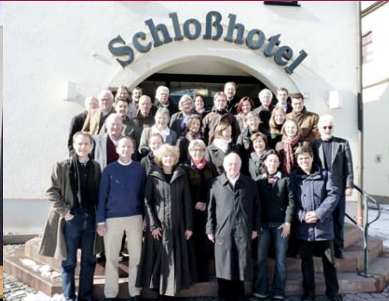
Pressekonferenz zu Parteisponsoring