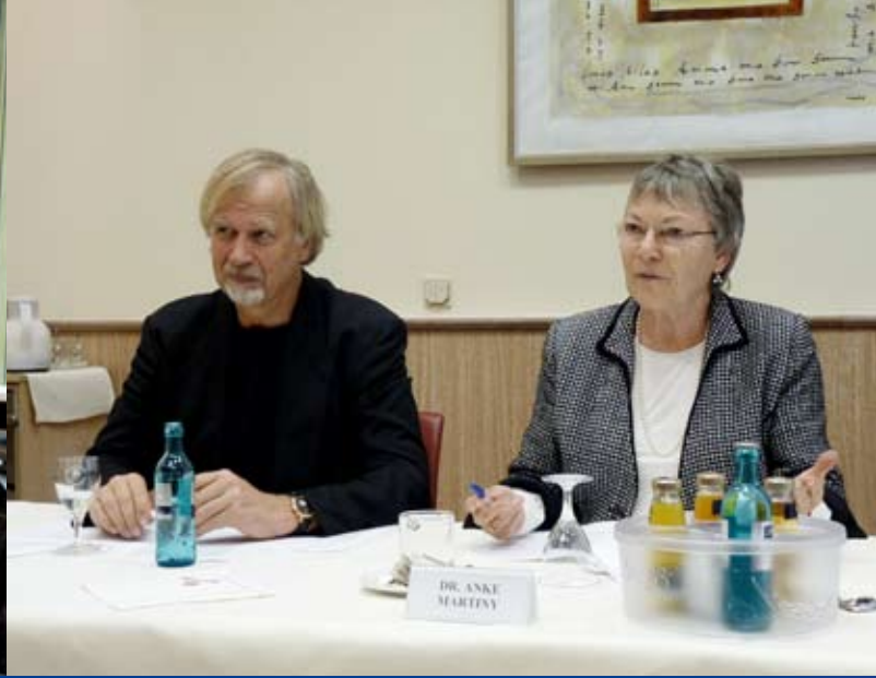
Transparency Deutschland fordert das Verbot von Anwendungsbeobachtungen