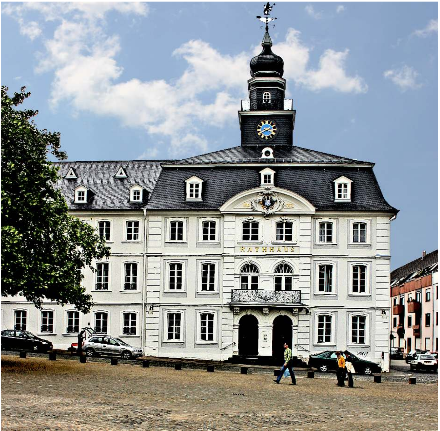
Rathaus in Alt-Saarbrücken