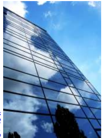
Ein gläsernes Rathaus braucht nicht unbedingt eine Glasfassade...

An dieser erfolgreichen Entwicklung hat Transparency Deutschland keinen geringen Anteil: Die Arbeitsgruppe Informationsfreiheit (Südliche Bundesländer) gehört zu den Begründerinnen des Bündnisses „Informationsfreiheit für Bayern“ im Jahr 2004. Dieses seither auf 15 Organisationen