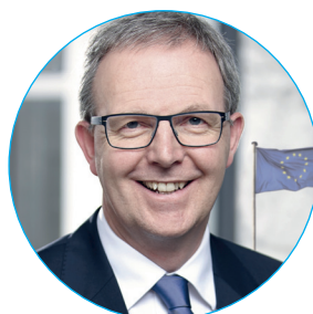
Axel Voss (CDU) aus Niedersachsen EU-Abgeordneter seit 2009 und Berichterstatter (= Zuständiges Ausschussmitglied für einen konkreten Gesetzesvorschlag) für die Urheberrecht-Richtlinie